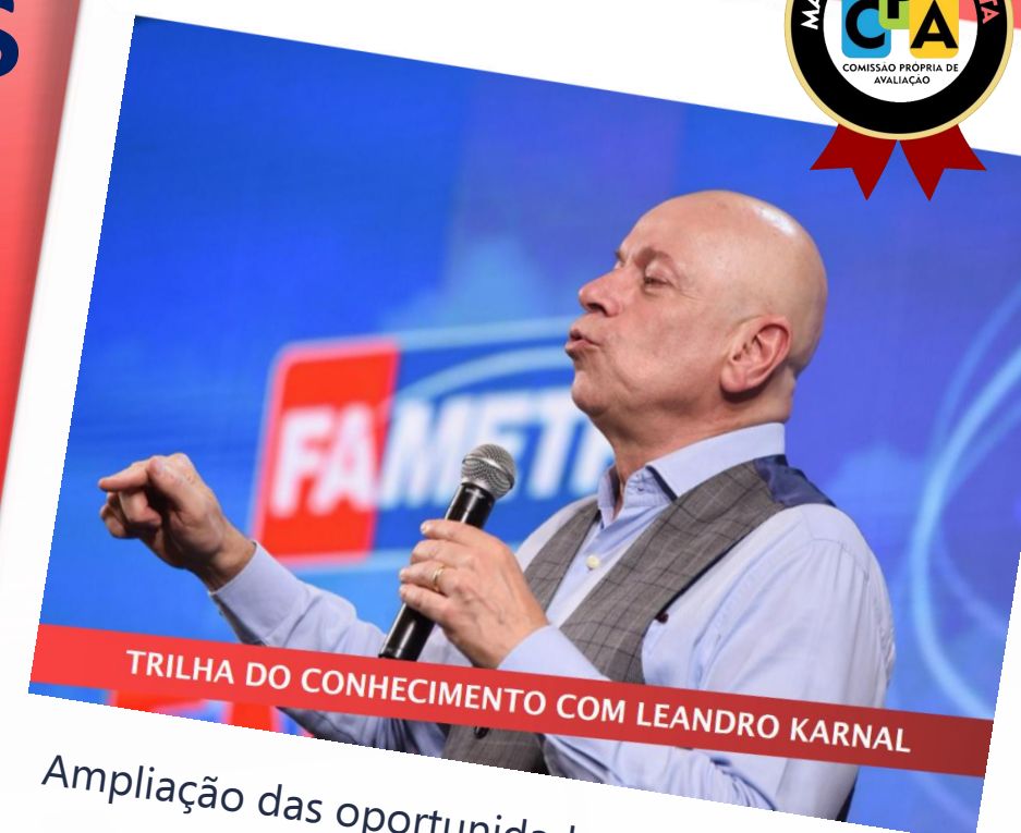
TRILHA DO CONHECIMENTO COM LEANDRO KARNAL

Ampliação das oportunidades de formação e capacitação de alunos e professores.